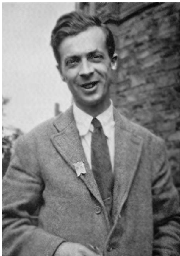
Джулиан Хаксли. 1920