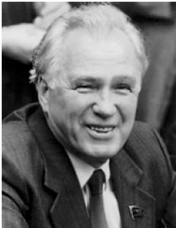
Иван Тимофеевич Фролов (1929–1999)

В связи с проблемами индивида Хаксли призывал всех ученых заняться исследованием глубин человеческого сознания, описываемого до сих пор лишь в религиозных или чисто функциональных терминах. “Психологические исследования сейчас важнее географических” 25 , — утверждает он. Сегодня проблема сознания — самая обсуждаемая в современной философии. Попытка создать новую, всеобъемлющую философскую и нравственную систему, ставящую человека в центр своей проблематики и призванную в новых условиях обеспечить единство человечества, его гармонию с окружающим миром и с самим собой, роднит эволюционный гуманизм Дж. Хаксли с “новым гуманизмом” русского философа И.Т. Фролова.