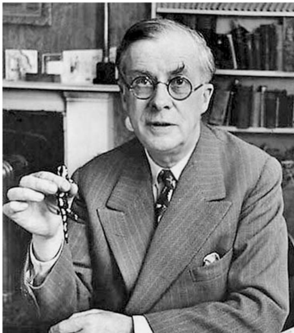
Джулиан Хаксли (1885–1975)

Среди инициаторов создания международных организаций в 1945 году были не только политики, но и ученые, осознававшие глубинный смысл происходящего. С помощью вновь создаваемых международных организаций они стремились найти формы гуманистического управления глобальными процессами, чтобы сделать общественное развитие подконтрольным человеку. В основе этих устремлений и лежала идеология современного гуманизма, в соответствии с которой высшим критерием всякого прогресса служит благо человека. Поэтому в ряду выдающихся гуманистов, перечисленных в начале статьи, свое законное место занимает ученый, мыслитель и общественный деятель, создатель концепции эволюционного гуманизма, один